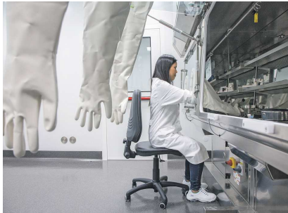
In einem sehr aufwändigen Prozess wird in dem Gebäude ein Qualitätskontrolllabor aufgebaut, denn für die Kontrastmittel gelten höchste Ansprüche an Sterilität. Der Aufbauprozess wird sich noch bis ins Jahr 2018 hineinziehen.

Es war ein großer Schock für die Region gewesen, als ein skandinavisches Pharma-Unternehmen Nycomed einen Rückzug hier aus der Region ankündigte, doch letztlich war es eine Chance, die gerade zugunsten des Standorts Singen bestens genutzt wurde. Das sieht man nicht nur beim japanischen Unternehmen Takeda, das den Singener Standort zum größten Teil übernommen hatte und schon hunderte Millionen Euro in den weiteren Ausbau investierte. Ein Teil der Produktion am Standort Singen wurde damals vor sechs Jahren an die italienische Bracco-Gruppe veräußert, die hier das Unternehmen »BIPSO« aufbaute. Und auch hier wird seither kräftig investiert, denn dieser Ankauf war für die Bracco-Gruppe eine einmalige Gelegenheit, die genutzt wurde. Die italienische Bracco-Gruppe aus Mailand, übrigens ein Familienunternehmen, hat damit freilich auch eine große Herausforderung übernommen. BIPSO produziert in Singen für Märkte weltweit Kontrastmittel, die beim Röntgen, der Computer- und Magnetresonanztomografie sowie