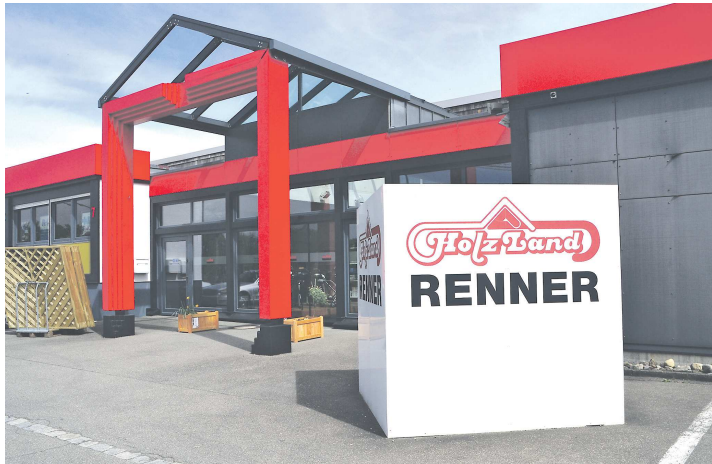
Bei Holzland Renner hat der totale Räumungsverkauf begonnen.

ZUM JAHRESENDE SCHLIESST SINGENER TRADITIONSUNTERNEHMEN