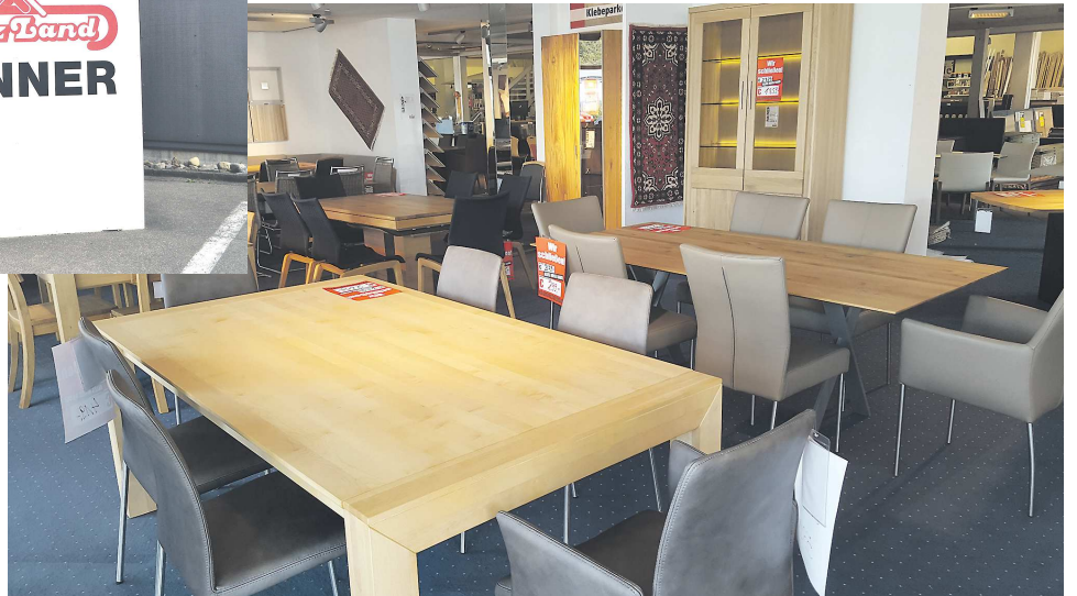
Ein breites Angebotssortiment erwartet die Kunden beim Räumungsverkauf von Holzland Renner - auch hochwertige Massivholzmöbel.

lange überlegt und nun eine Entscheidung getroffen, die uns sehr schwer gefallen ist«. Dem Singener Süden wird nach der Schließung eine besondere Adresse mit einem hochwertigen Sortiment für Haus und Garten fehlen. Stefan Mohr mohr@wochenblatt.net