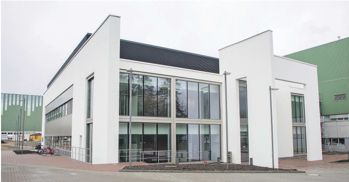
Das neue Qualitätskontrolllaborgebäude von BIPSO im Singener Industriepark wurde Anfang des Jahres fertig gestellt.

SINGENER STANDORT IST WICHTIGSTER PRODUKTIONSSTANDORT DER BRACCO-GRUPPE